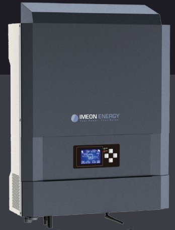
IMEON 3.6 Однофазне рішення