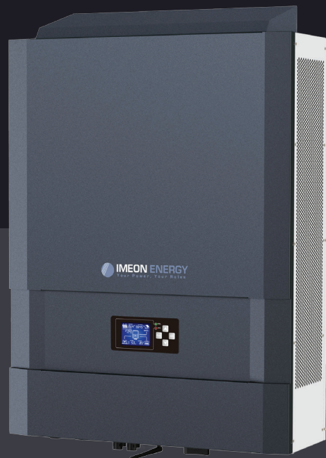
IMEON 9.12 Трифазне рішення